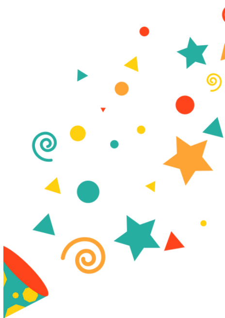
PAGE 7 ET 8 | ANIMATIONS