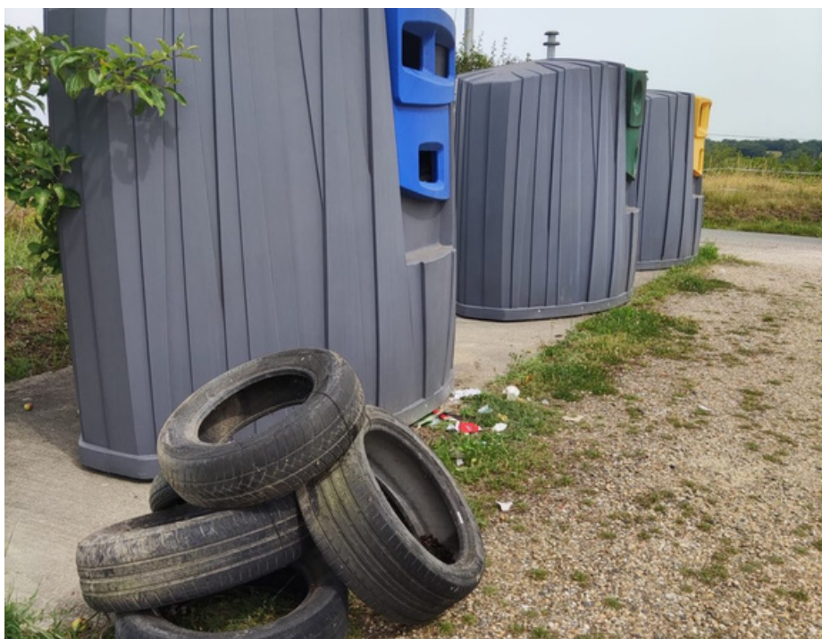
PAGE 2 | ÉDITO DU MAIRE