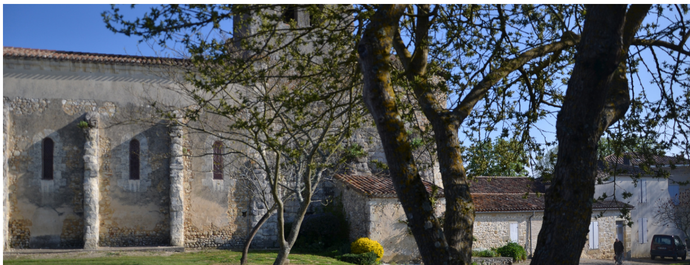
ÉGLISE TEMPLIÈRE DE ROMESTAING

Le 13 octobre 1307, Philippe IV ordonne l'arrestation de tous les templiers du royaume de France qui se comptent par plusieurs milliers.