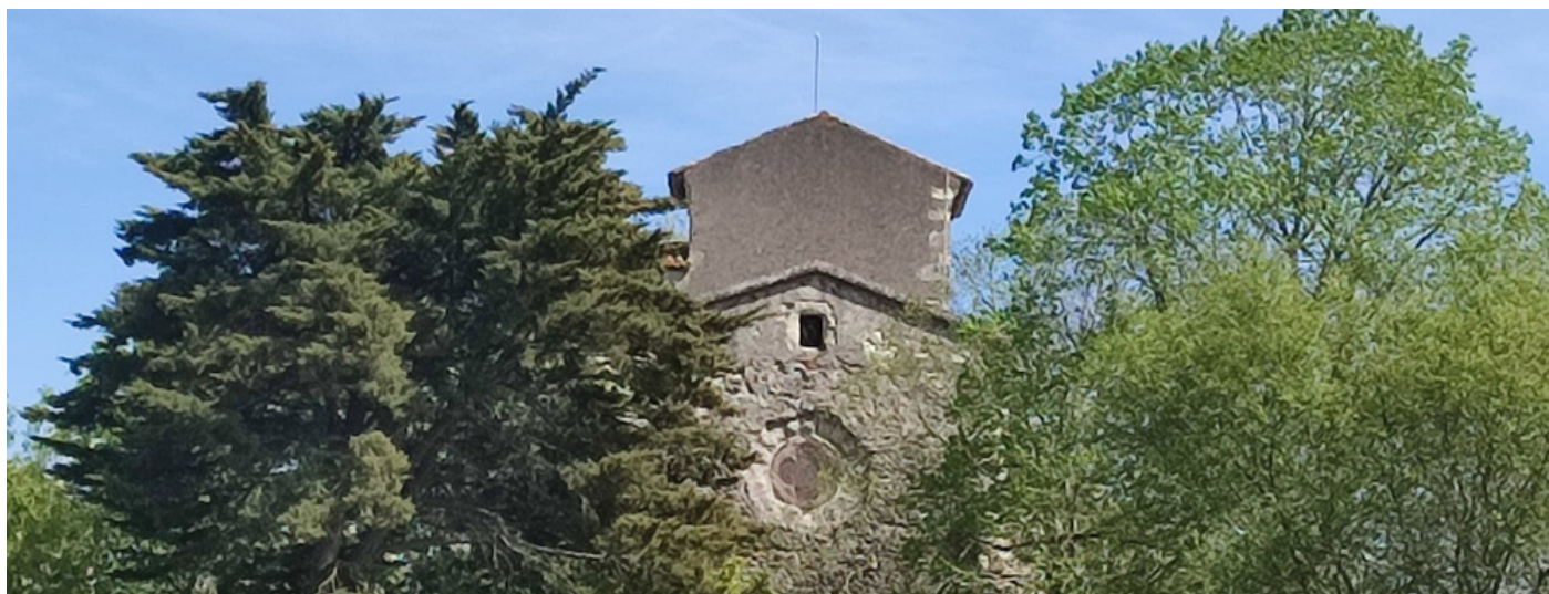
ÉGLISE TEMPLIÈRE DE ROMESTAING