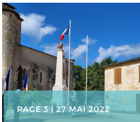
PAGE 3 | 27 MAI 2022