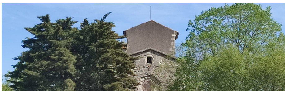
PAGE 4, 5 ET 6 | L'HISTOIRE DE ROMESTAING