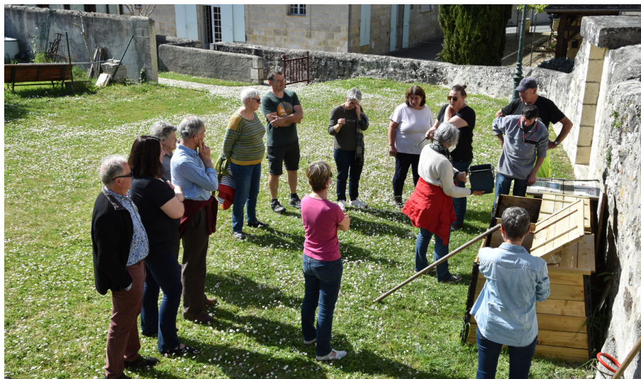
FORMATION DES ÉLUS RÉFÉRENTS COMPOSTAGE PARTAGÉ